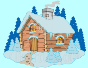
小木屋旅館 xiǎo mù wū lǚ guǎn