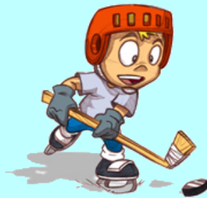
曲棍球 qū gùn qiú