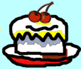
蛋糕 dàn gāo