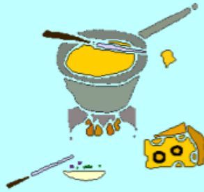
乳酪 rǔ luò 火 huǒ 鍋 guō