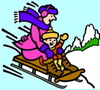
滑雪橇 huá xuě qiāo