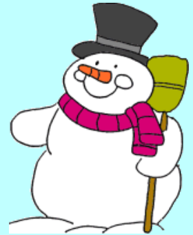
堆雪人 duī xuě rén